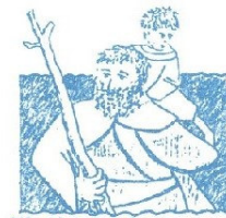
Kindergarten St. Christophorus